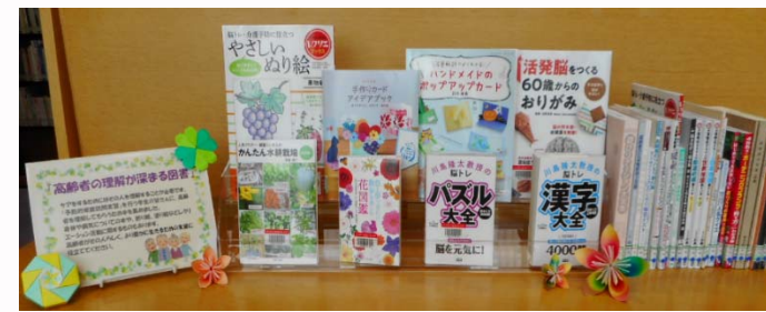
「高齢者の理解を深める図書」は1階閲覧室奥のテーブルに置いています。

昨年度から引き続き、高齢者を理解してもらうための図書を 集めて展示しています。病気に 関する本や、園芸、折り紙、 体操など様々な本を置いて います。「予防的家庭訪問実習」 に役立ててください。