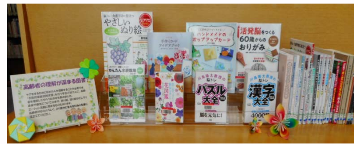
「高齢者の理解を深める図書」は1階閲覧室奥のテーブルに置いています。

昨年度から引き続き、高齢者を理解してもらうための図書を 集めて展示しています。病気に 関する本や、園芸、折り紙、 体操など様々な本を置いて います。「予防的家庭訪問実習」 に役立ててください。