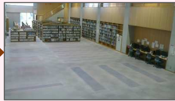
足場を撤去し、工事完成 これから書架を元の位置に戻します