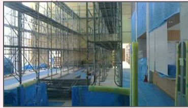
図書館入口側の天井を工事中です