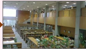
12/7 開館 より安全で明るい図書館になりました