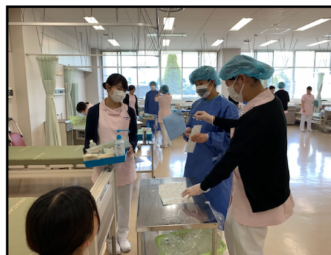
Eラーニングシステムによる事前学習後、グループ演習を行います。