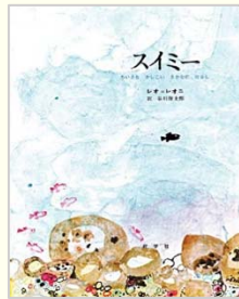
スミミー レオ・レオニ【作】 谷川俊太郎【訳】 好学社

大型絵本とは、一度に大勢の人を対象に読み聞かせをするために、作者の許可を得て拡大製作された絵本です。普通の絵本の2倍以上の大きさがあるので迫力満点です。今回、図書館では4冊の大型絵本を購入しました。実習での読み聞かせなどにも利用できますので、貸出ご希望の方は図書館カウンターまでお越しください。