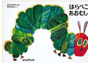
はらぺこあおむし エリック・カール【作】 もり ひさし【訳】 偕成社