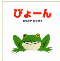
ぴょーん まつおか たつひで【作・絵】 ポプラ社