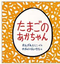
たまごのあかちゃん かんざわ としこ【文】 やぎゆうけんいちろう【絵】 福音館書店