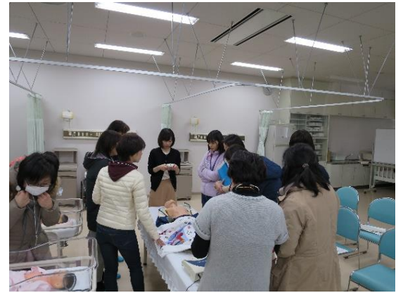
訪問看護師研修会の講師の様子